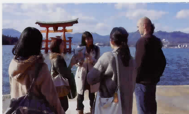
大鳥居の構造について解説

午後は、石鳥居前で再び外国人観光客に声をかけ、ガイドを申し出ます。石鳥居から厳島神社まで約1時間でご案内しました。