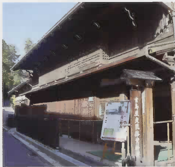
宮島歴史民俗資料館

豊国神社本殿は、はじめ「経堂」として天正15年(1587)に豊臣秀吉によって建立が発起された宮島随一の巨大な建物です。江戸時代には「大経堂」、あるいは畳を千枚敷けるほどの広さ「千畳敷」と呼ばれました(実際には約850枚)。明治の神仏分離後には本尊釈迦如来像・阿難尊者像・迦葉尊者像は大願寺(宮島)に移され、秀吉を祀る豊国神社となりました。