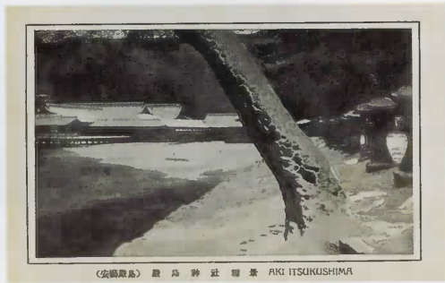
(安福原島) 厳島神社雪景 AKI IITSUKUSHIMA