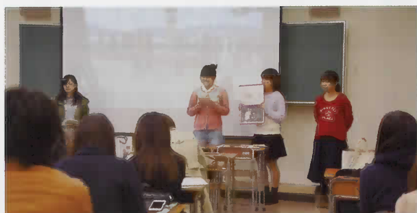
学内でバーチャルガイド

今年度も、平成26年11月22日(土)と29日(土)に実施し、アメリカ、アルジェリア、オーストラリア、シンガポール、スペインの外国人観光客を、厳島神社、大願寺、豊国神社(千畳閣)などへ案内しました。