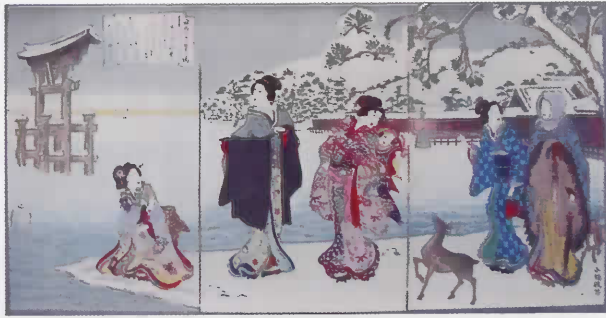
「日本三景の内 宮島」