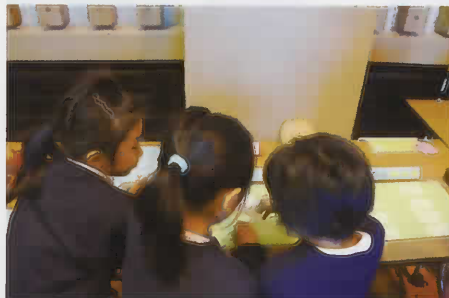
「厳島八景」の パズルで遊ぶ 子どもたち