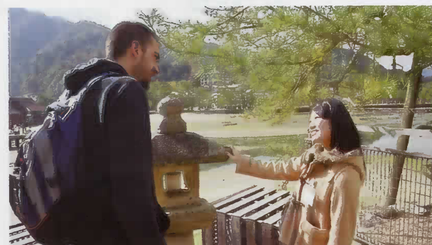
大鳥居の構造について解説

午前中のガイドは、宮島棧橋に到着後、海岸通りを経て、石鳥居・狛犬・石灯籠・大鳥居の前を通って厳島神社に参拝します。神社の出口付近で解散する、約1時間半のコースでした。